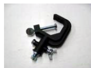
GONG アルミハンガー C-05-2B